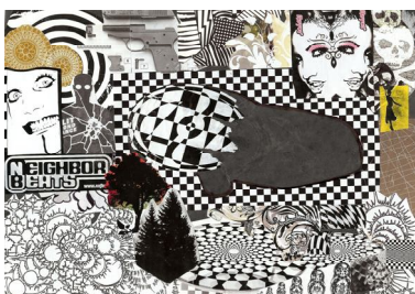
Lucie Grmelová: Černá a bílá

jsou každoročně pořádány u příležitosti výročí zahájení provozu. Letos se dveře otevřou pro všechny zájemce již po devatenácté, a to po oba dny vždy od 10 00 do 16 00 hodin. Dále nabízíme: občerstvení, diskuse, individuální konzultace, možnost videoprojekce, seznámení s novými projekty MK a Výroční zprávou MK za rok 2010, volný pohyb po areálu MK nebo prohlídku s průvodcem, prodejní výstavu výtvarných a rukodělných prací žáků i dospělých uživatelů služeb, prodej odborné literatury.